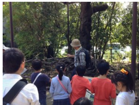
植物園見学ツアー